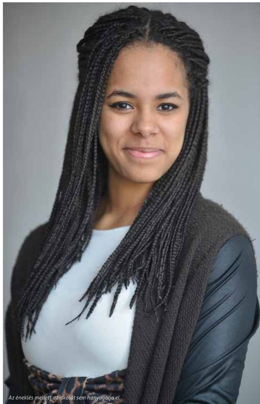
Az éneklés mellett az iskolát sem hanyagolja el

Amióta itt állunk a folyosón, rengeteg gyerek köszönt neked, még alsósok is. Ez mindig így volt, vagy csak azóta, hogy szerepeltél a tévében? Sok diákot ismerek, de a műsor óta érezhetően többen figyelnek rám. A kicsik nagyon aranyosak, ideszaladnak hozzám, megölelnek, és elmondják, hogy szeretnek. Ezt meg kell szoknom. A gimnazisták között azonban nem változott a helyzet, szerencsére.