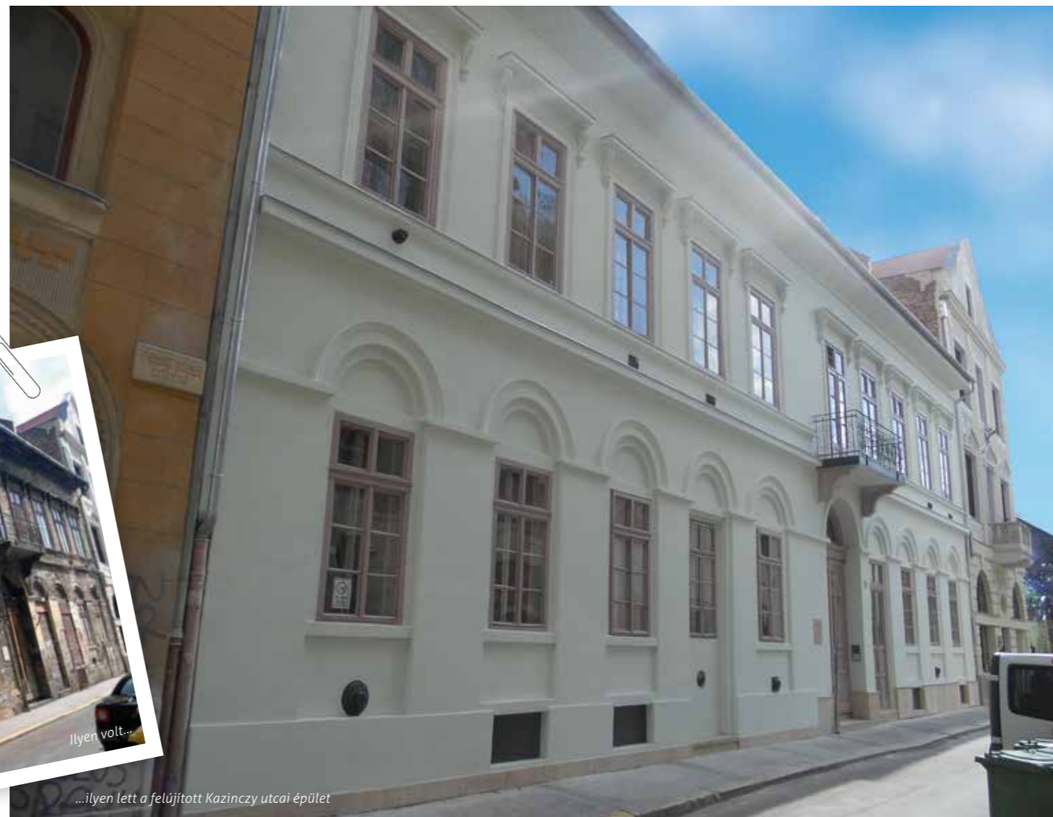
...ilyen lett a felújított Kazinczy utcai épület